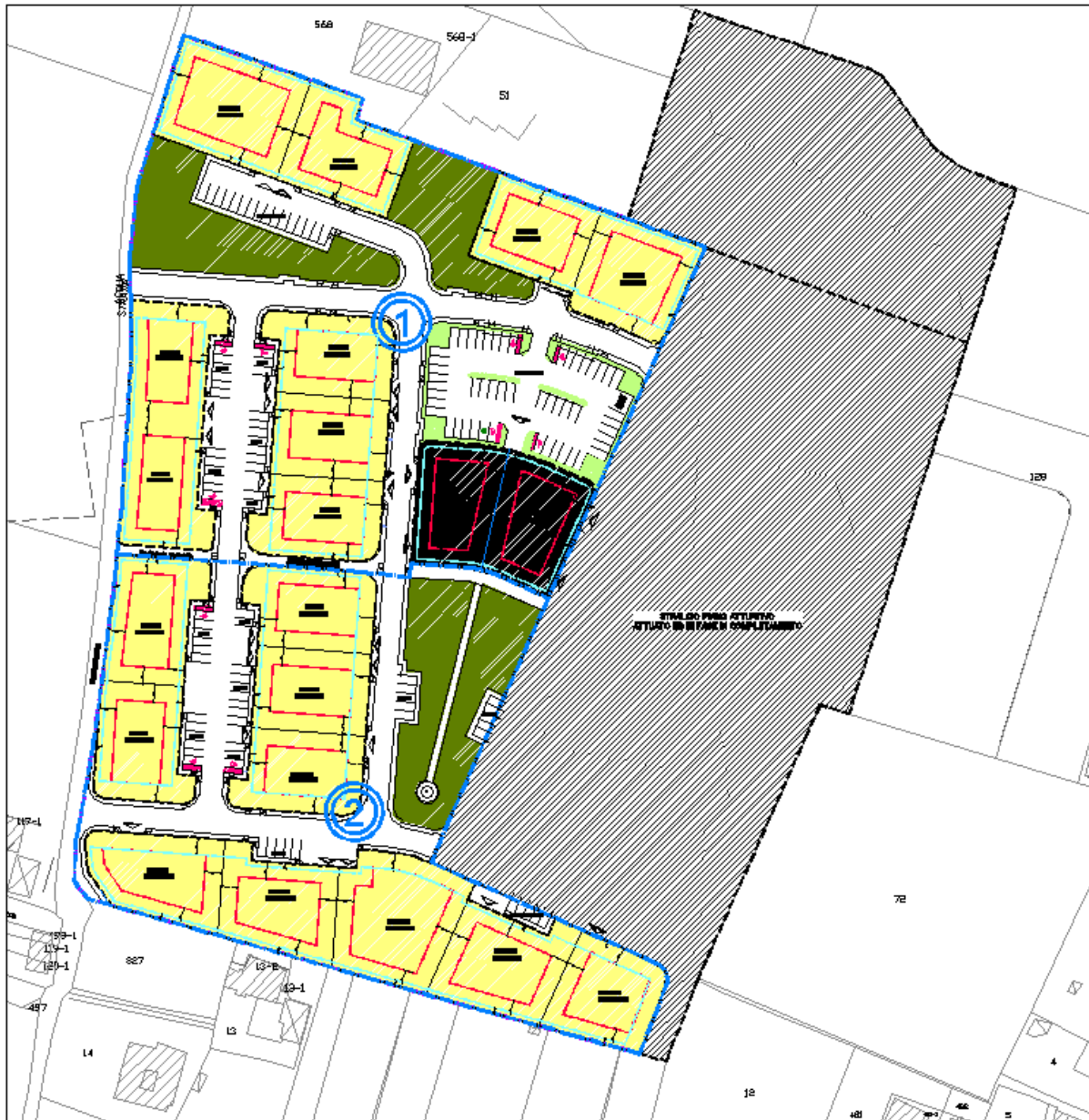
Planimetria Piano attuativo residuo da attuare