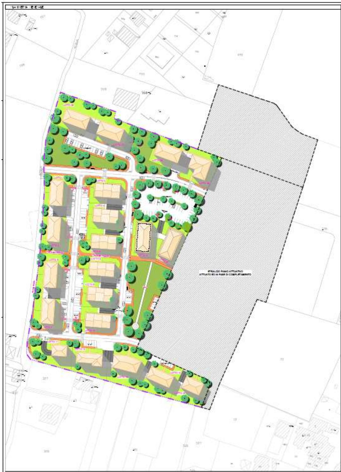
Planovolumetrico di progetto