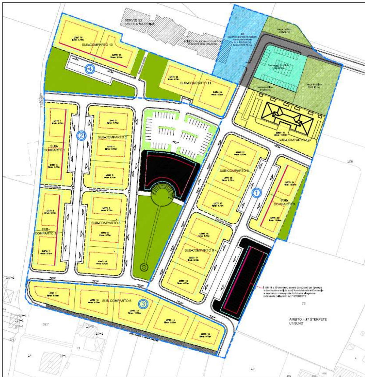
Planimetria dell'intero comparto APPROVATA con D.C.C. n. 17 del 21/02/2005

PROGETTO TOTALE = 76200 mc (NORMATIVA PREGRESSA ZONA UP/PDL - D.C.C. n.78 del 15/04/2004)