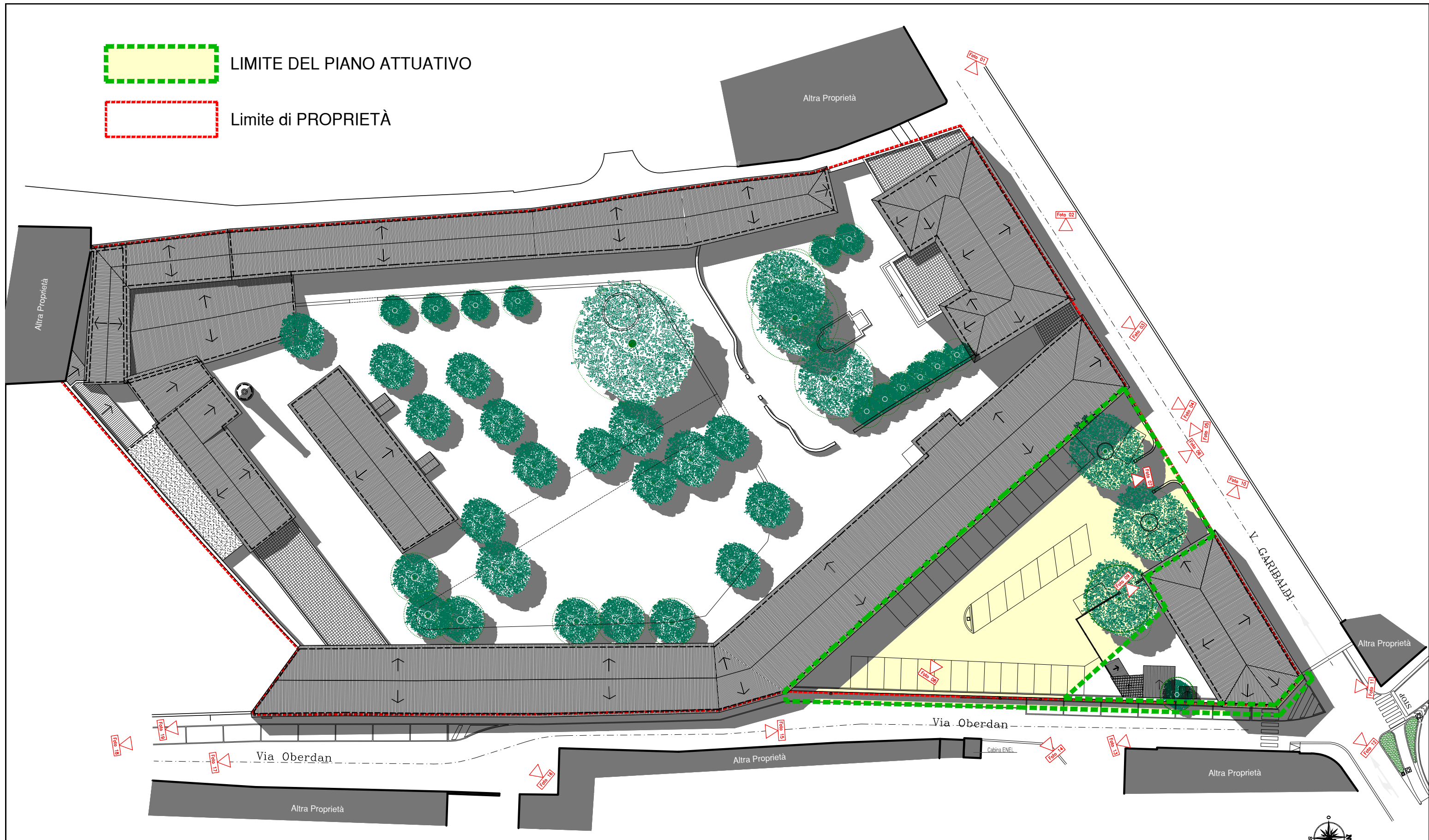
PLANIMETRIA GENERALE Punti di presa documentazione fotografica