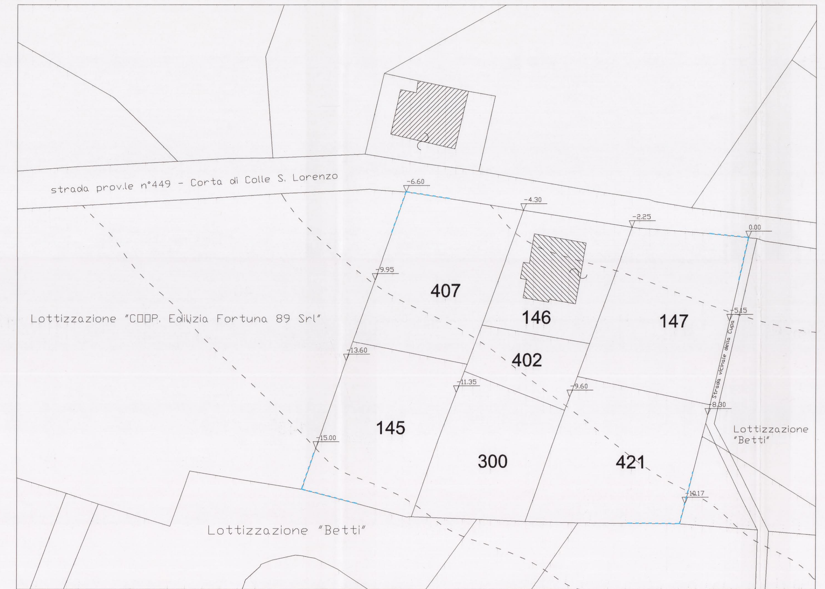
Piano quotato - rapp. 1:500