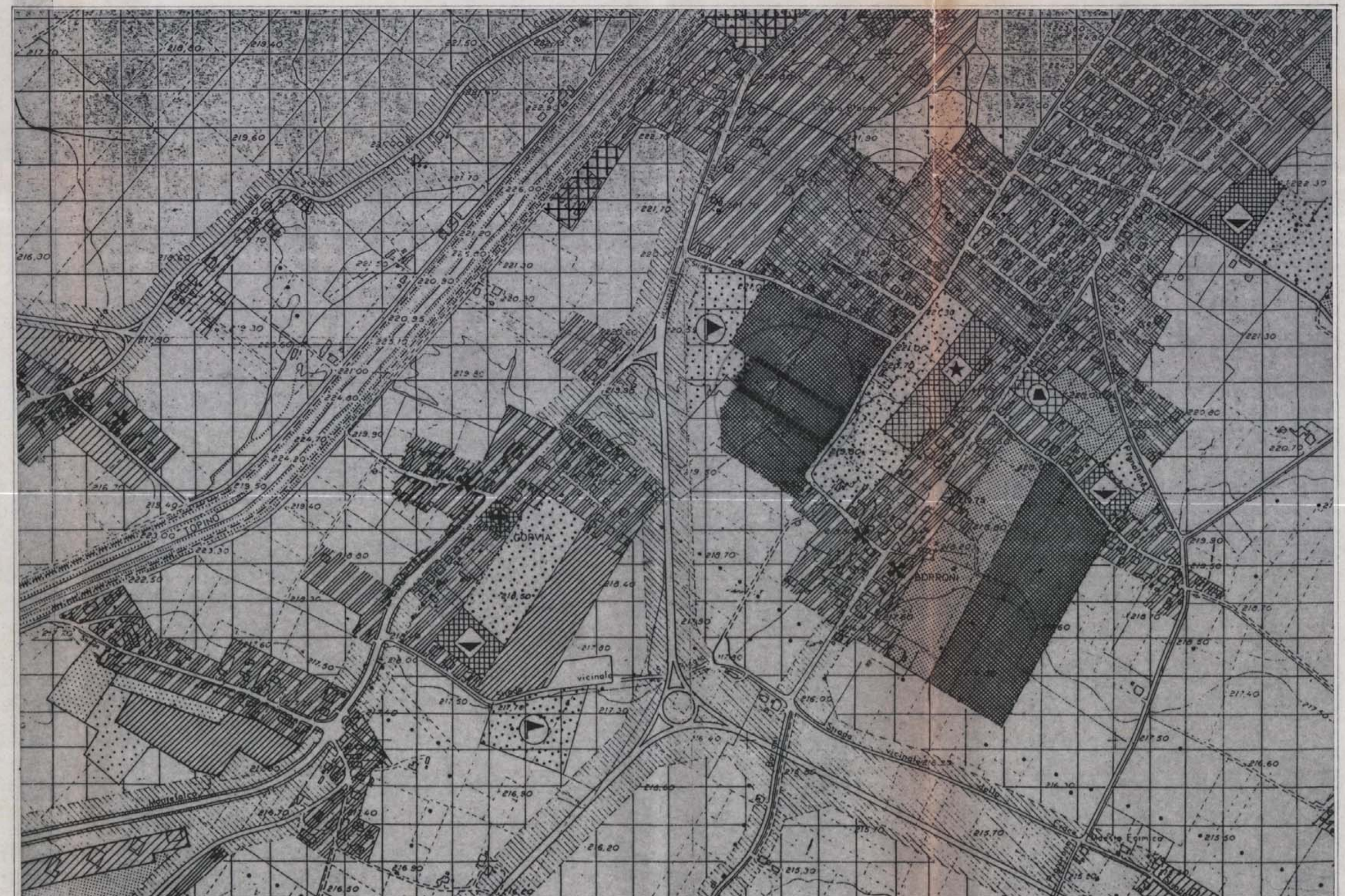
STRALCIO PRG scala 1:5000