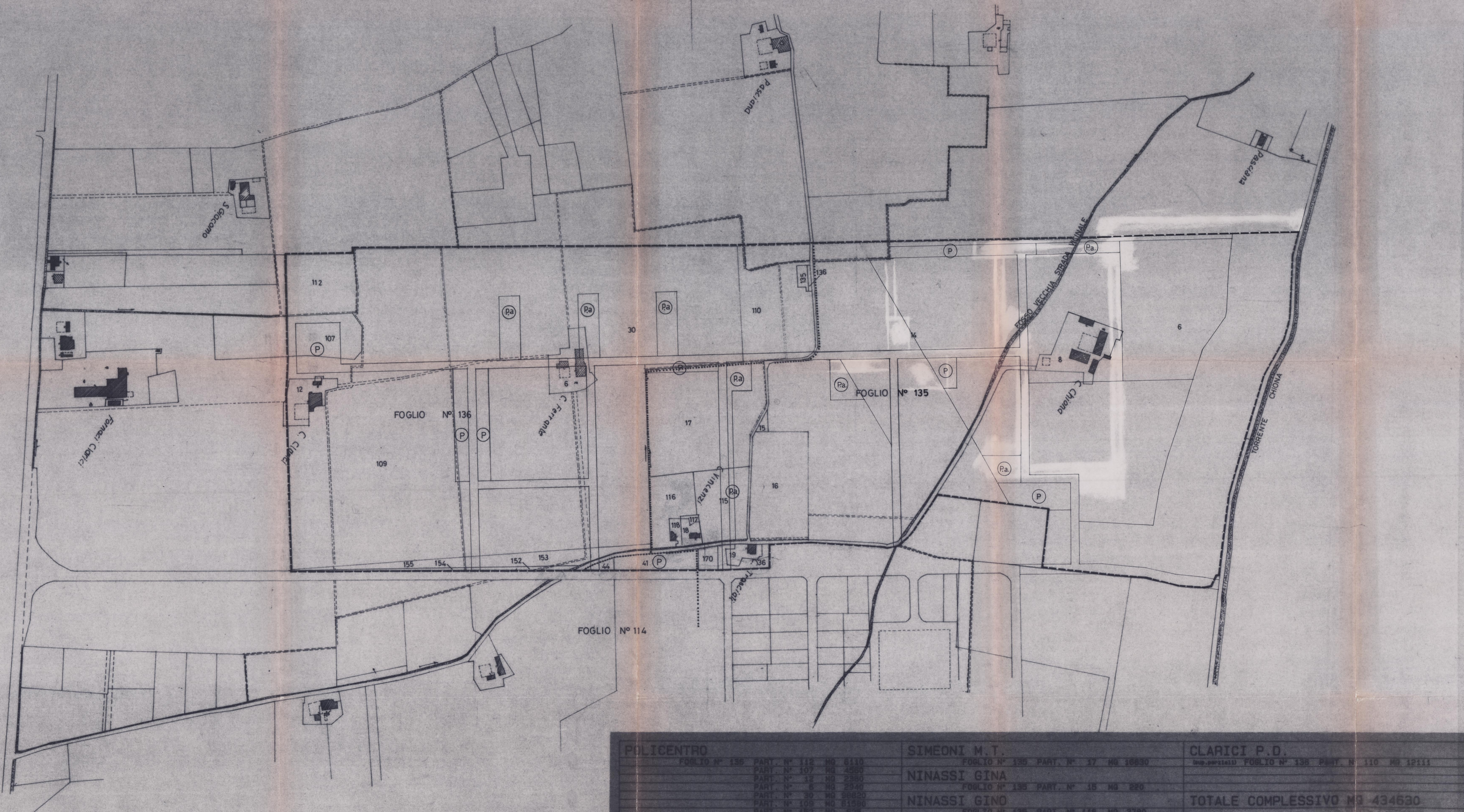
PLANIMETRIA CATASTALE SCALA 1:2000 --- PERIMETRAZIONE DEL COMPARTO D'INTERVENTO ..... DELIMITAZIONE DEI FOGLI CATASTALI