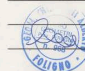
TAVOLA 3 SCALA 1:500