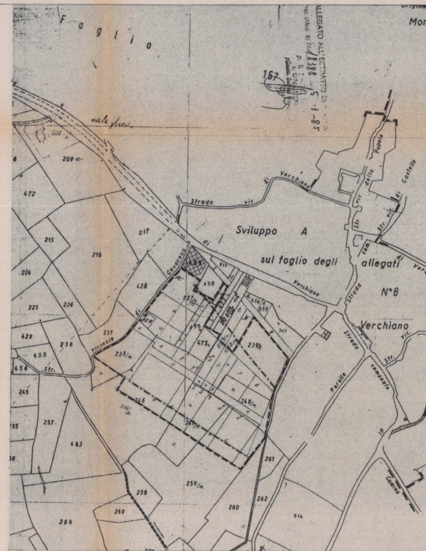
sovrapposizione catastale p.r.g.