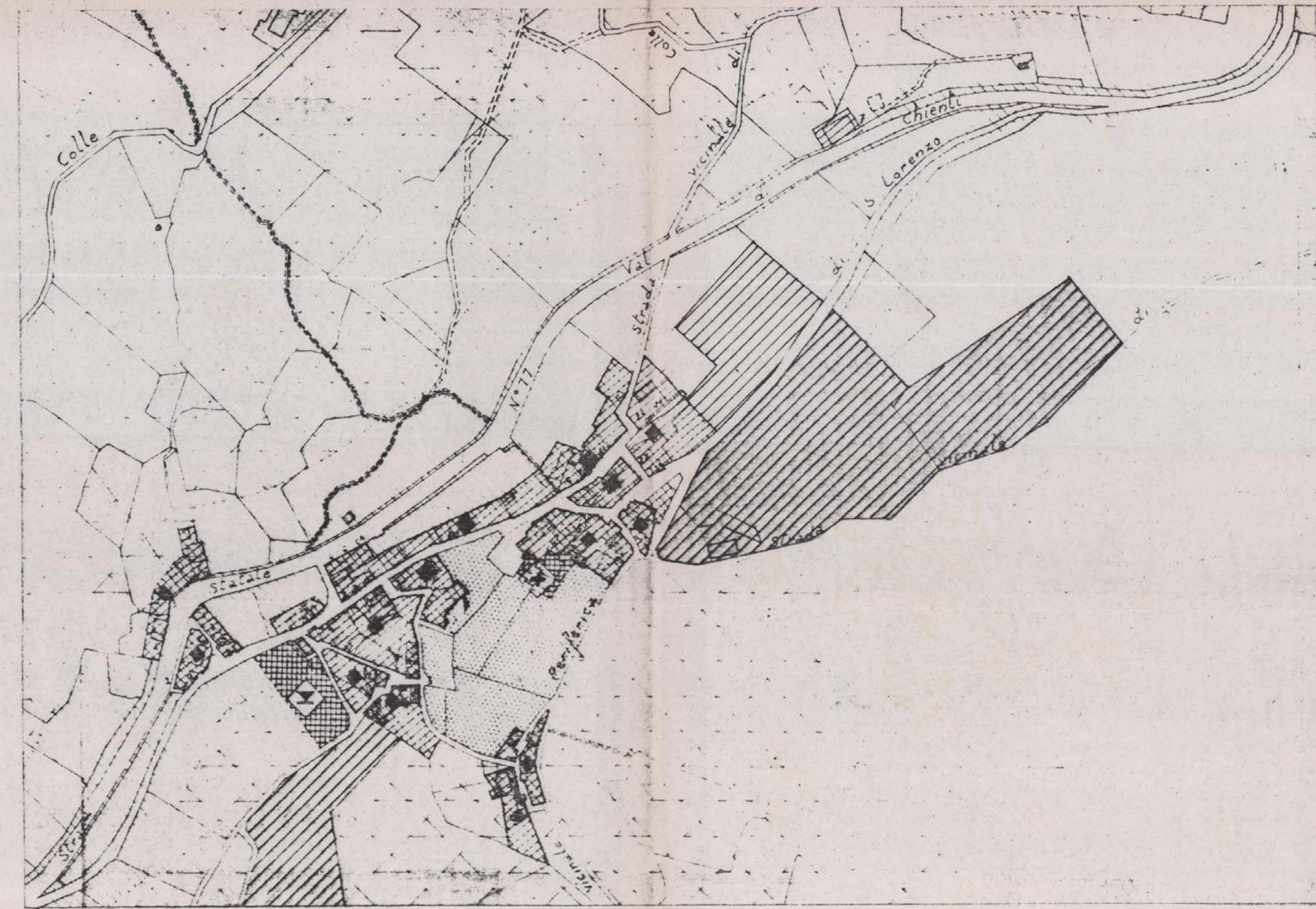
STRALCIO P. R. G. sc. 1:2000

COMUNE DI FOLIGNO - URBANISTICA ESAMINATO CON PARERE FAVOREVOLE E RELATIVE CONDIZIONI FAVOREVOLE DALLA COMMISSIONE URBANISTICA NELLA SEDUTA DEL 24.3.83 Il Segretario [Signature] APPROVATO CON DELIBERA C.C. N. 172 del 24.11.83