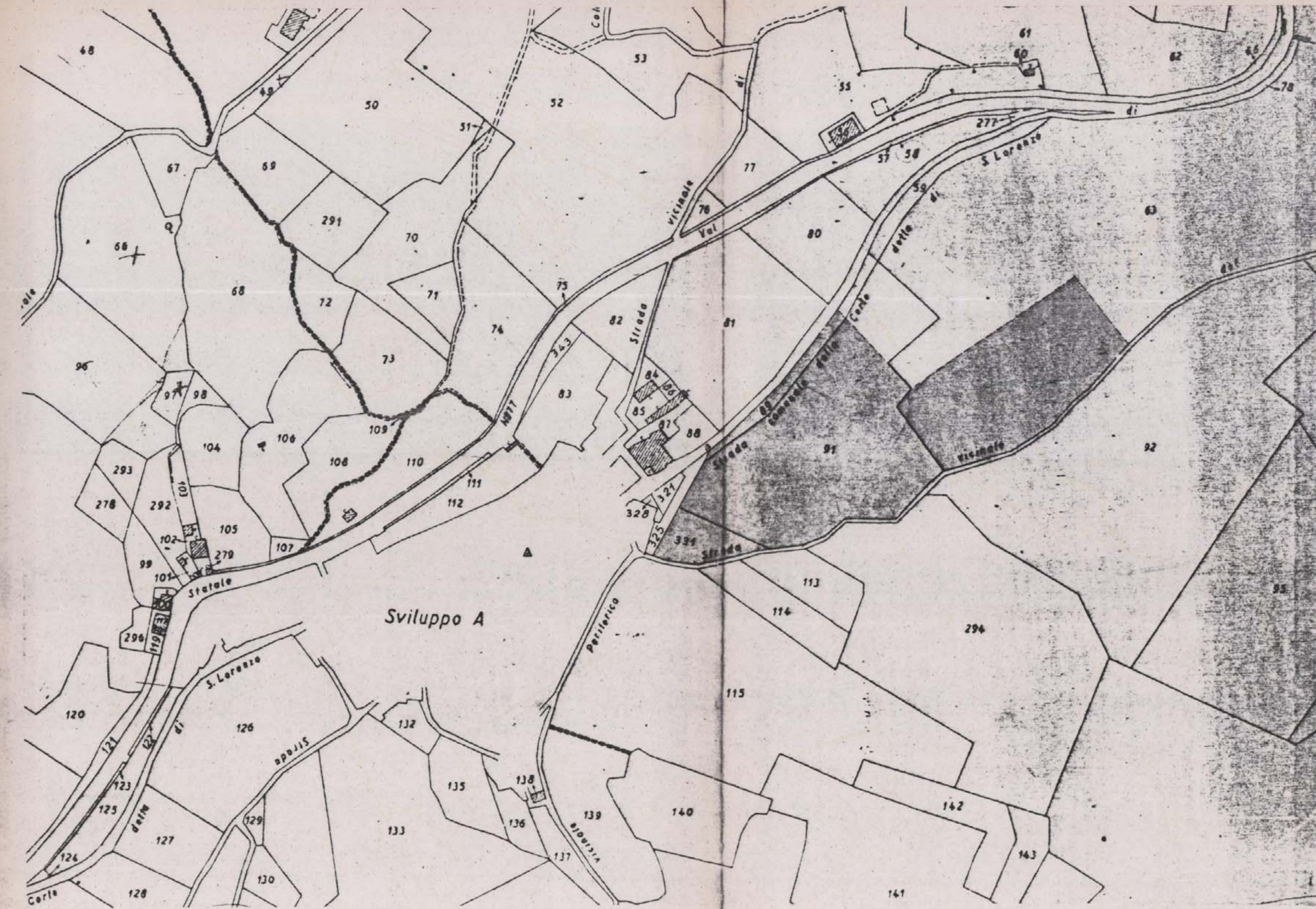
STRALCIO CATASTALE sc. 1:2000 FOGLIO n° 123