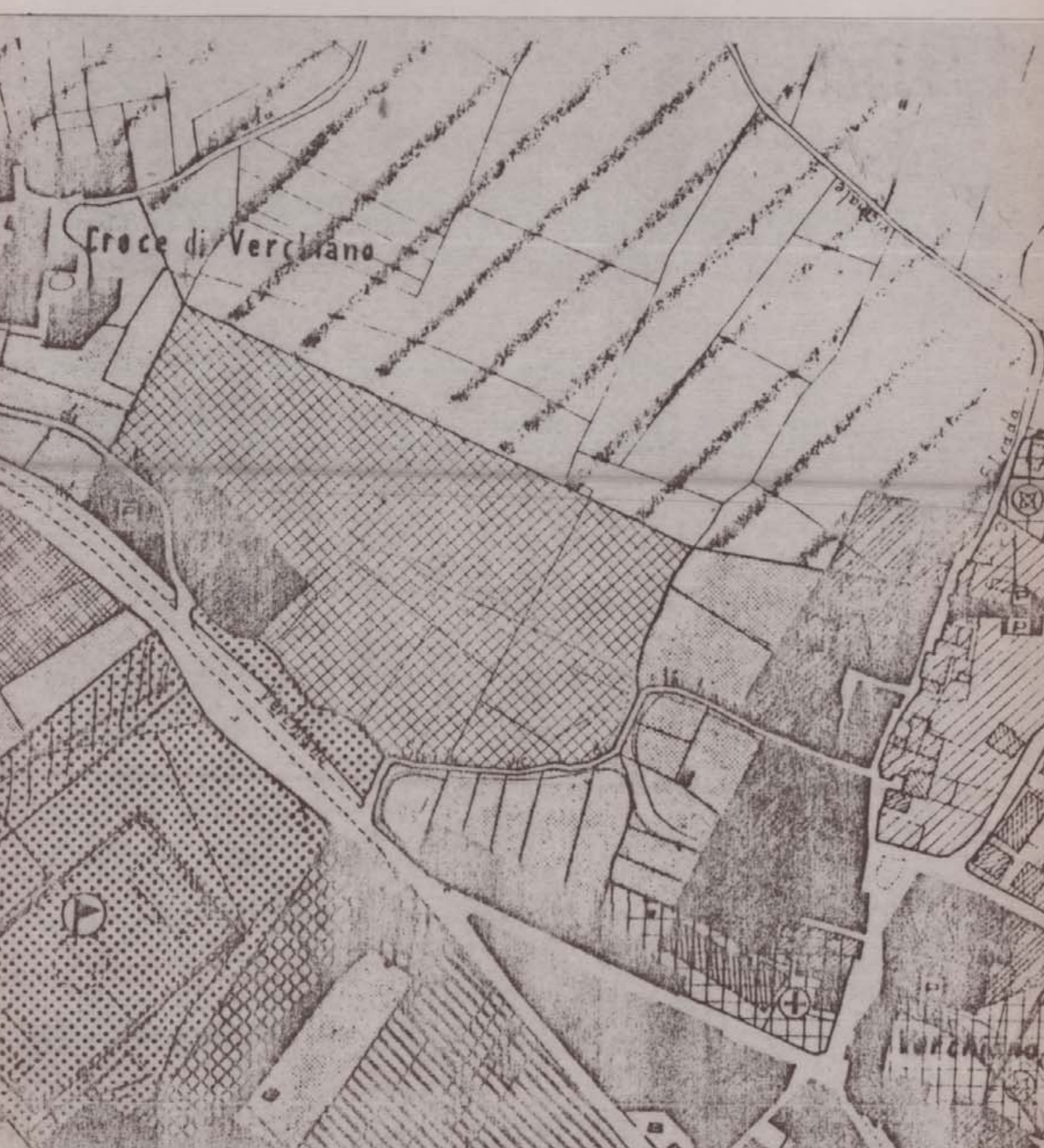
STRALCIO di P.R.G. Zona C1