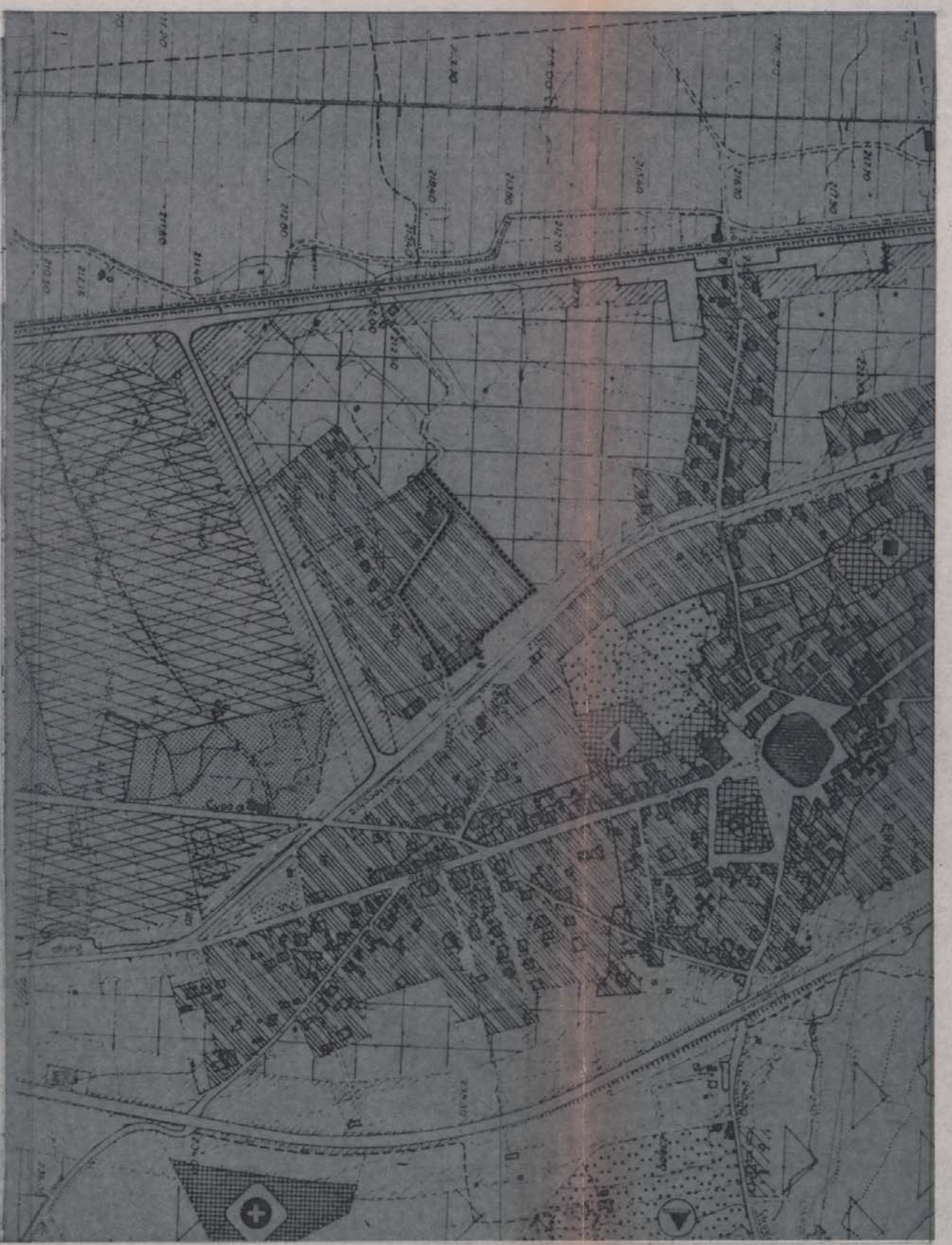
stralcio P.R.G. 1:5000