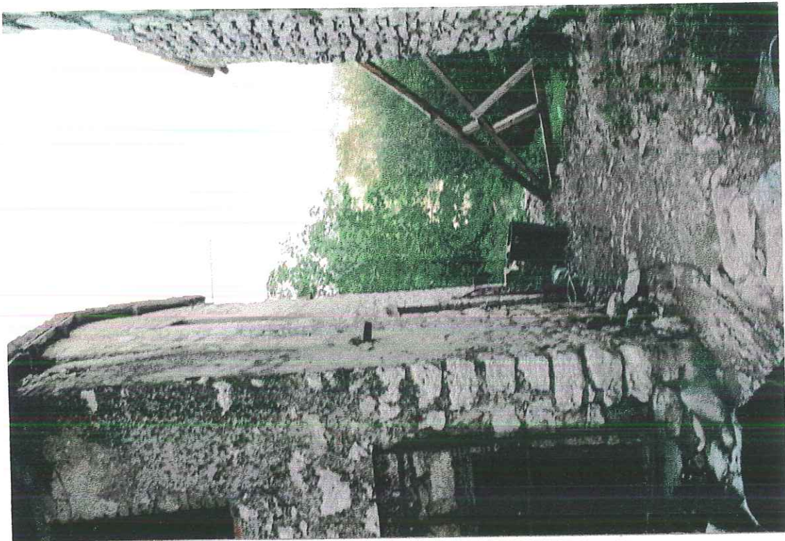
FOTO 8 - CASTELLO DI MORRO - U.M.I. 1