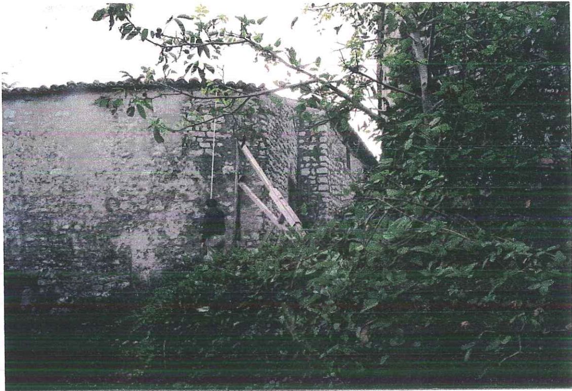
FOTO 5 - CASTELLO DI MORRO - U.M.I. 1