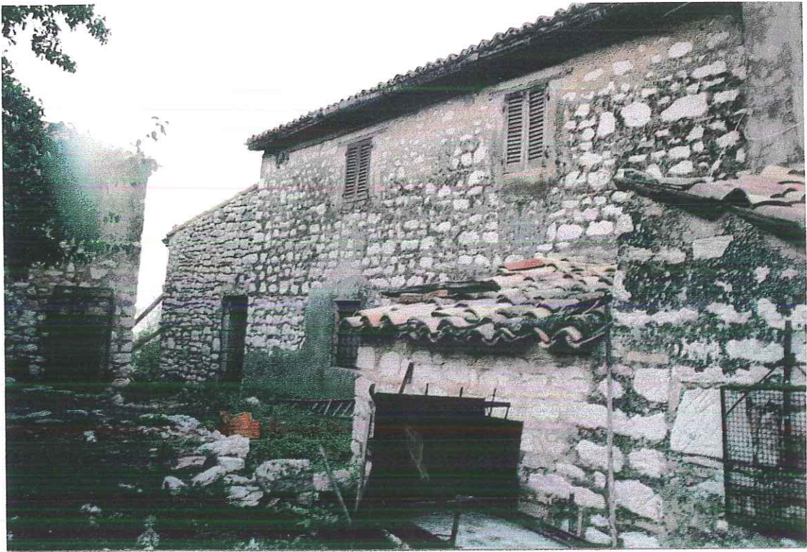
FOTO 7 - CASTELLO DI MORRO - U.M.I. 1