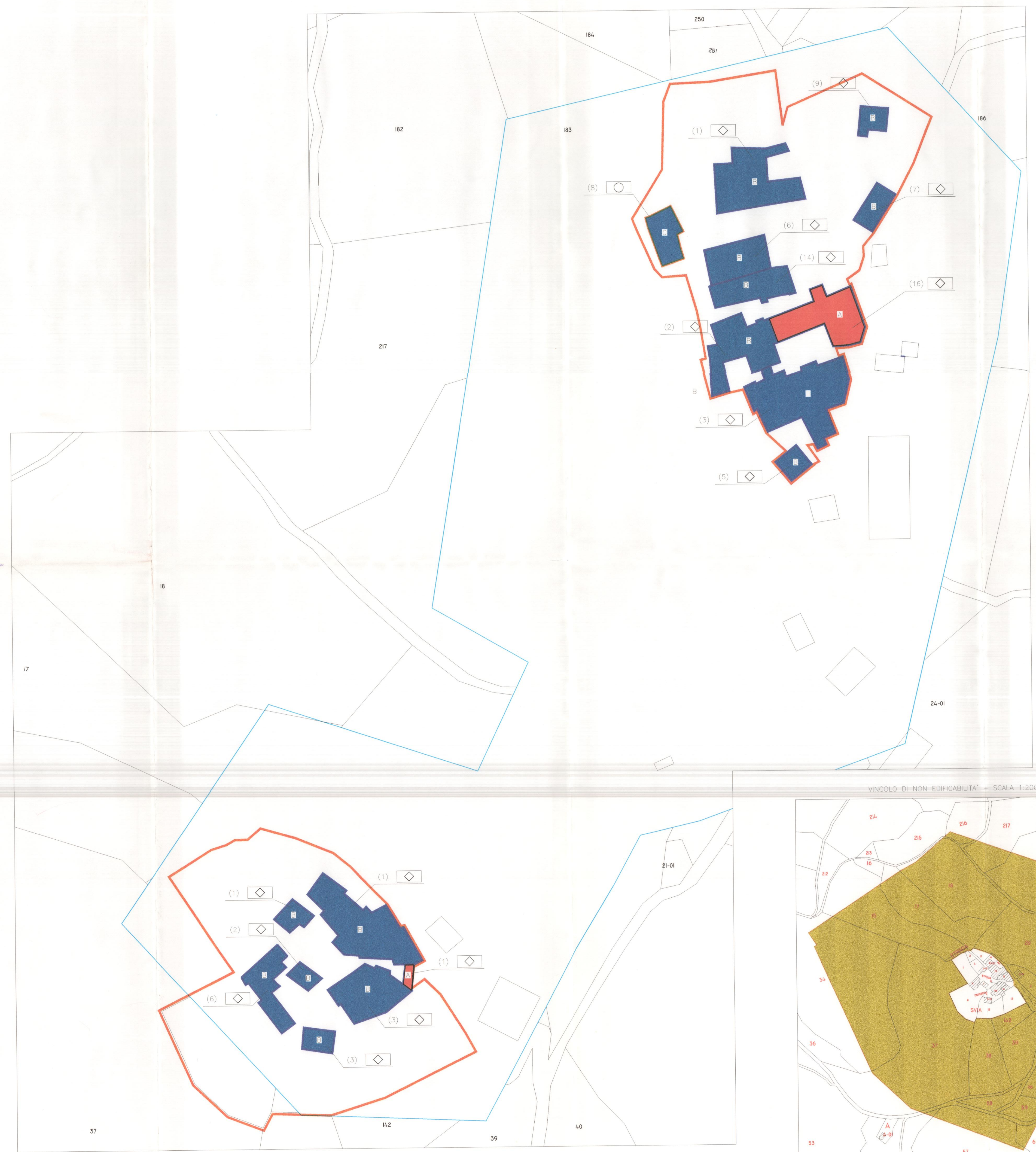
VINCOLO DI NON EDIFICABILITA' - SCALA 1:2000 (FASCIA DI RISPETTO 100m)