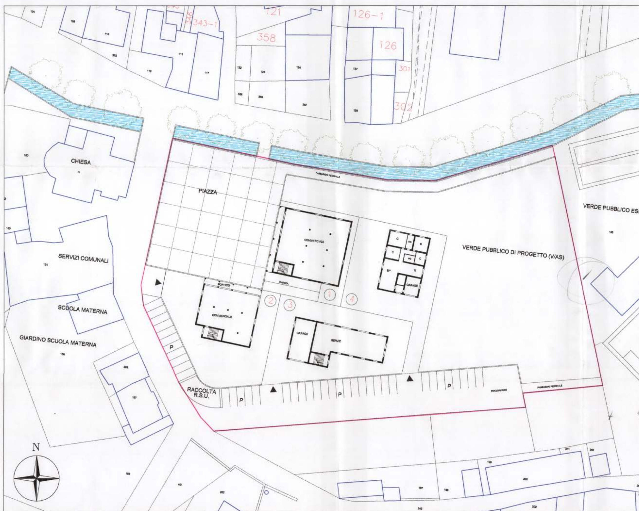
PIANTA PIANO TERRENO