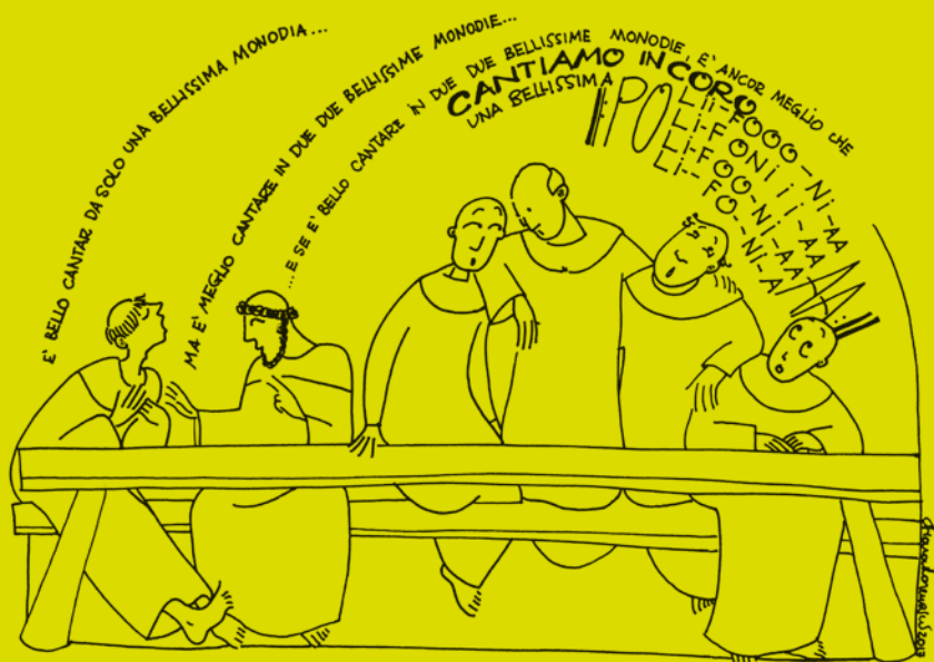
Illustrazione di Chiara Lorenzini

La pratica corale permette di avvicinarsi al mondo dei suoni nella forma più semplice e immediata possibile, attraverso il canto. Infatti la voce è il più antico e bello strumento musicale ed il canto corale la più alta espressione di comunione di sforzi, di volontà creativa e di comunicazione collettiva che non sacrifica nulla al calore del singolo. Il coro è lo strumento sociale per eccellenza: uno strumento musicale capace di concedere un approccio attivo alla musica senza discriminazioni di partenza e senza esasperate selezioni attitudinali.