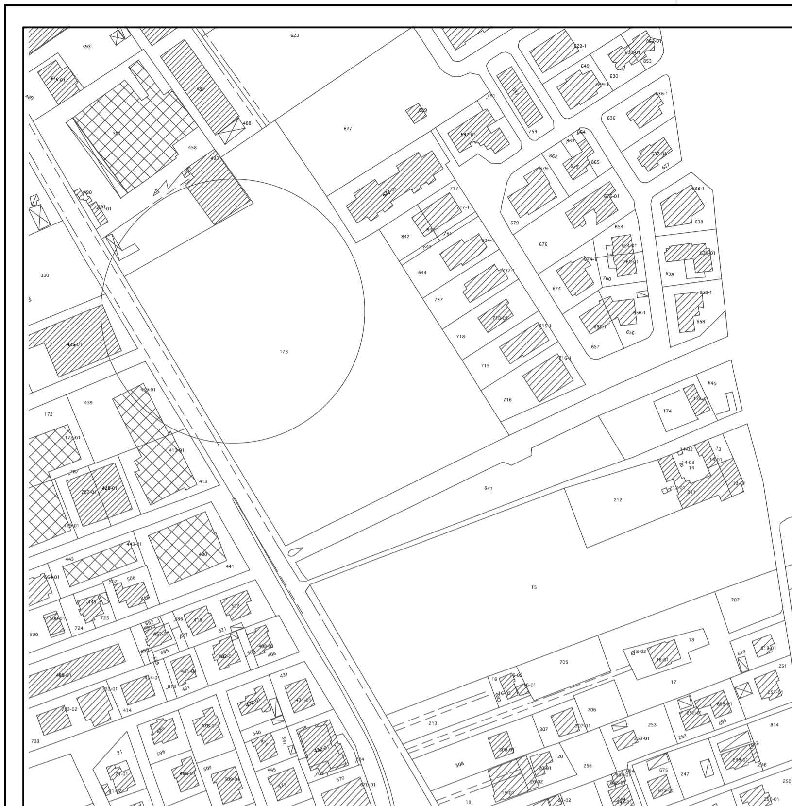
stralcio planimetria catastale N.C.T. scala 1:2000 foglio 176 part. 173

RadiAssociati via A.Mercuri, 10 - 06037 S. Eracleo di Foligno (PG) - tel./fax 0742 677173 - E-mail: radiassociati@iscall.it - P.I. 01856230541