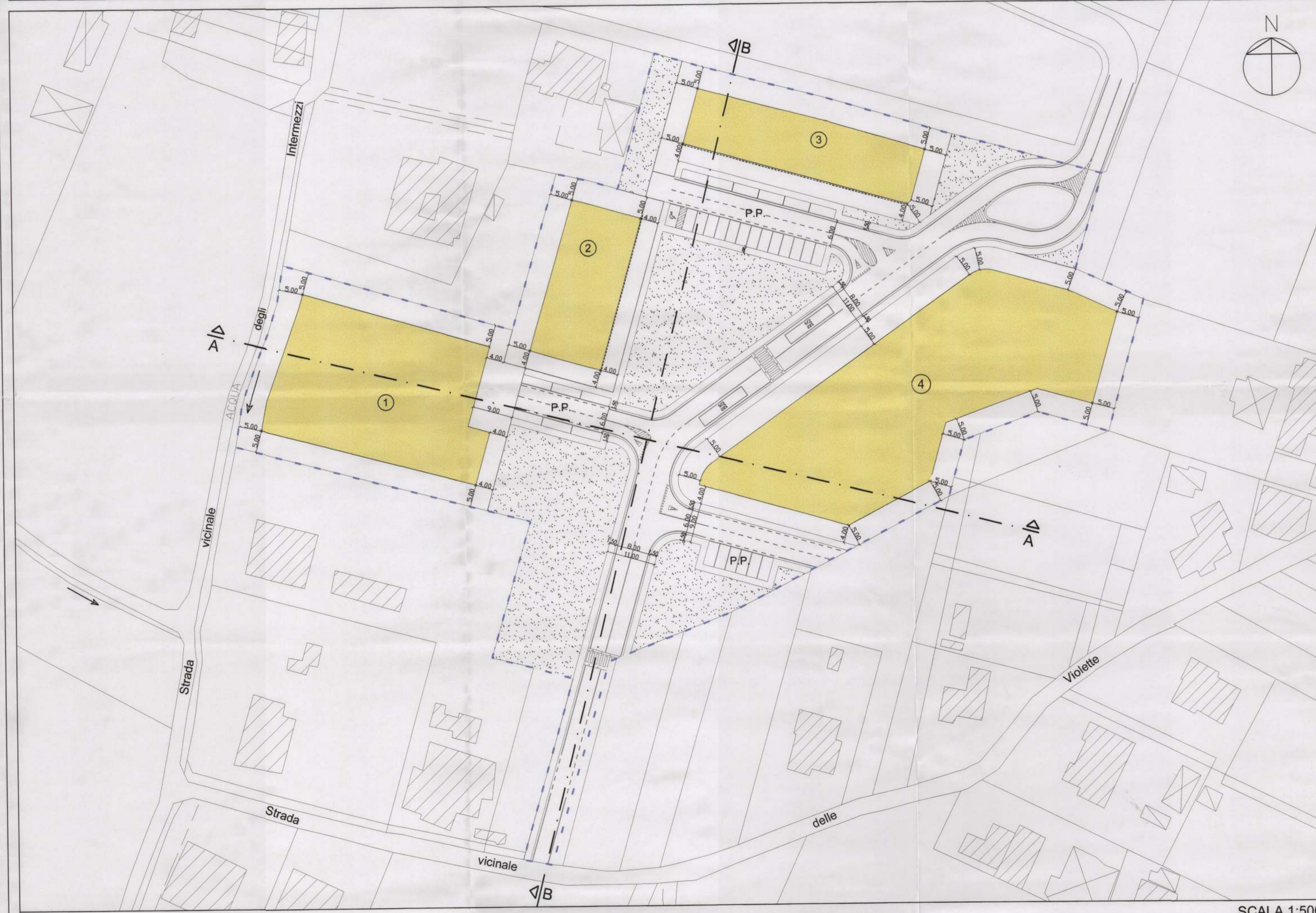
DESTINAZIONE D'USO DELLE AREE