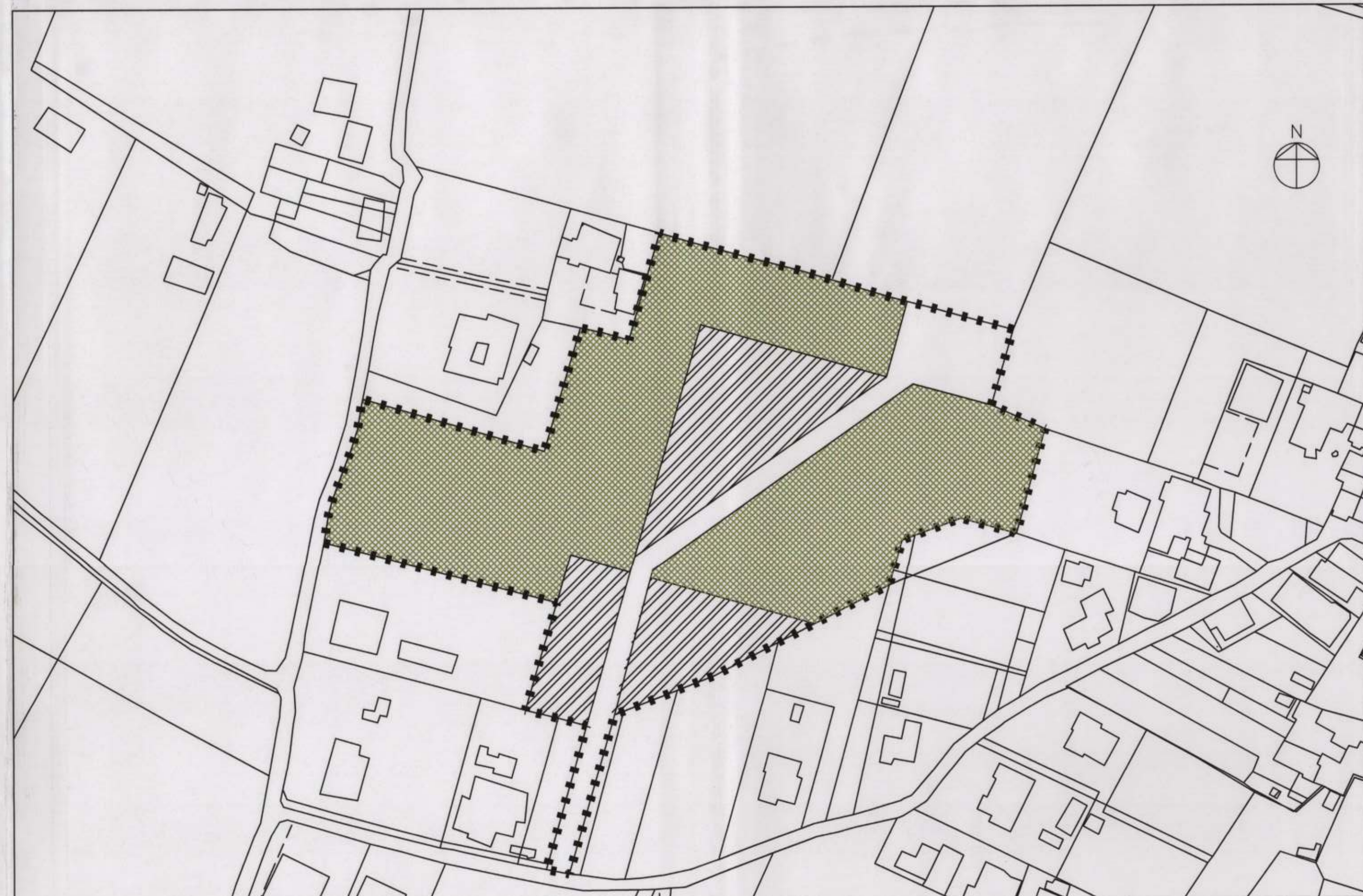
P.R.G. VIGENTE - ELEMENTI PRESCRITTIVI DEL DISEGNO DI SUOLO