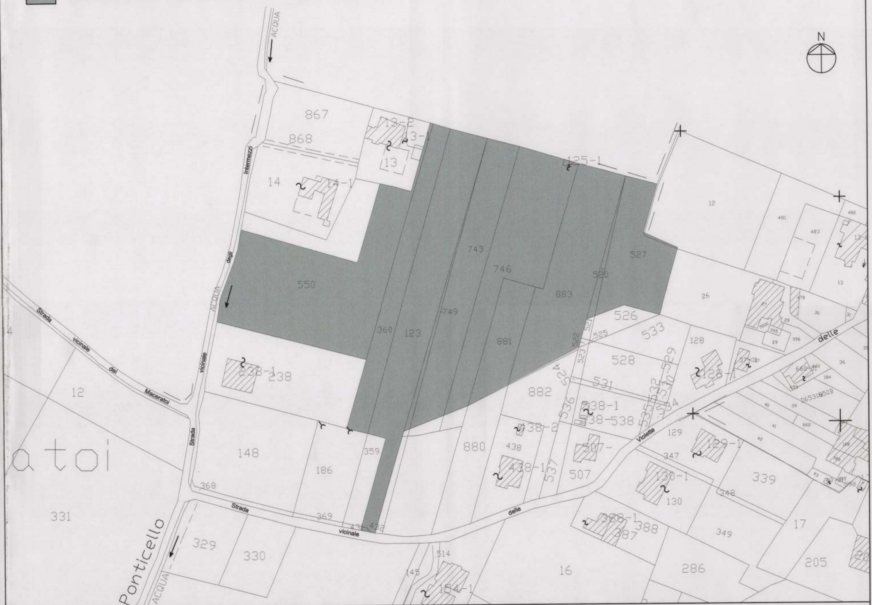
STRALCIO CATASTALE N.C.T. Foglio 213 Part.527,520,883,881,746,743,749,432,360,550,187,123