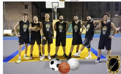
19° TORNEO DEI RIONI DELLA QUINTANA