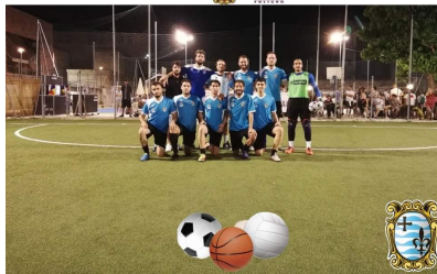
19° TORNEO DEI RIONI DELLA QUINTANA