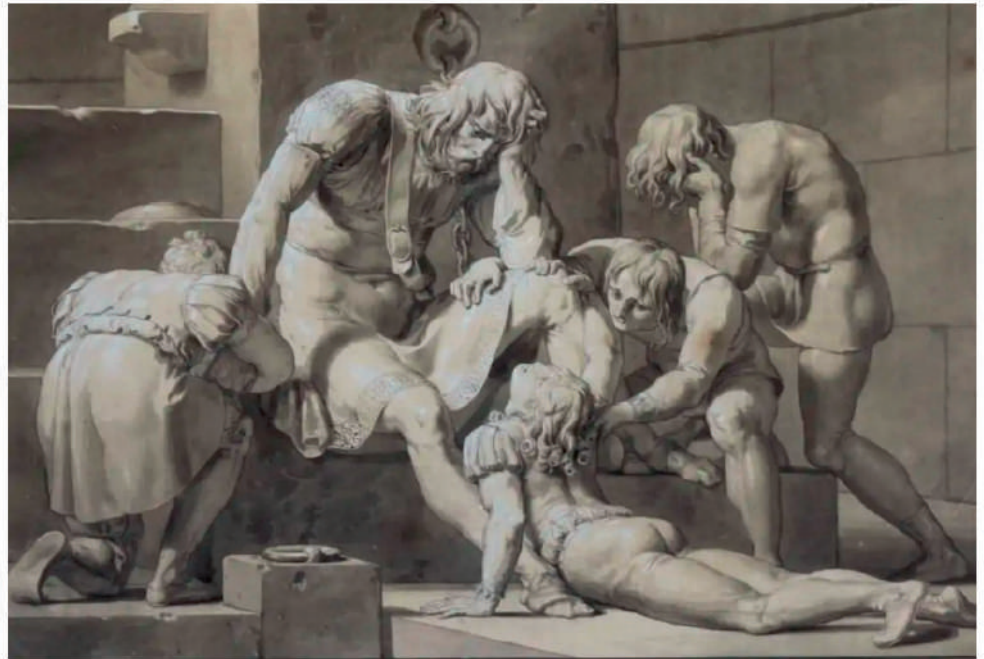
Pelagio Palagi, Il conte Ugolino imprigionato con i figli

Venite a intender li sospiri miei lyrica per baritono e pianoforte (1835)