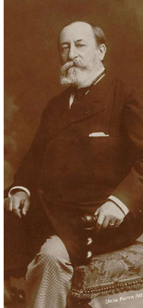
Maurice Senart et Cie