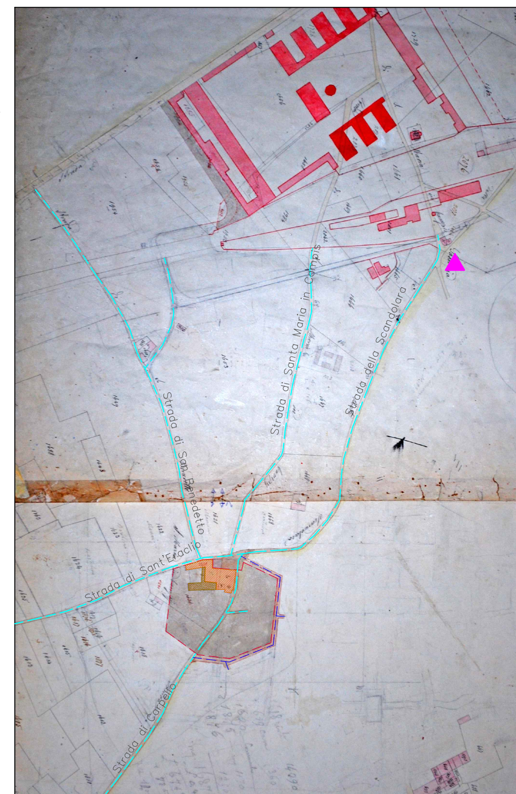
PLANIMETRIA CATASTO GREGORIANO (DATABILE 1820)